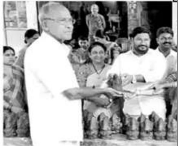
మట్టి వినాయక విగ్రహాలను పంపి