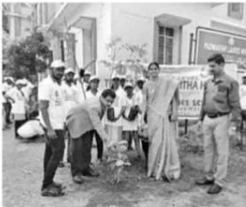
మొక్క నాటుతున్న రిజిస్ట్రార్ పురుషోత్తం

కేయా రిజిస్ట్రార్ ప్రాఫెసర్ కే పురుషోత్తం