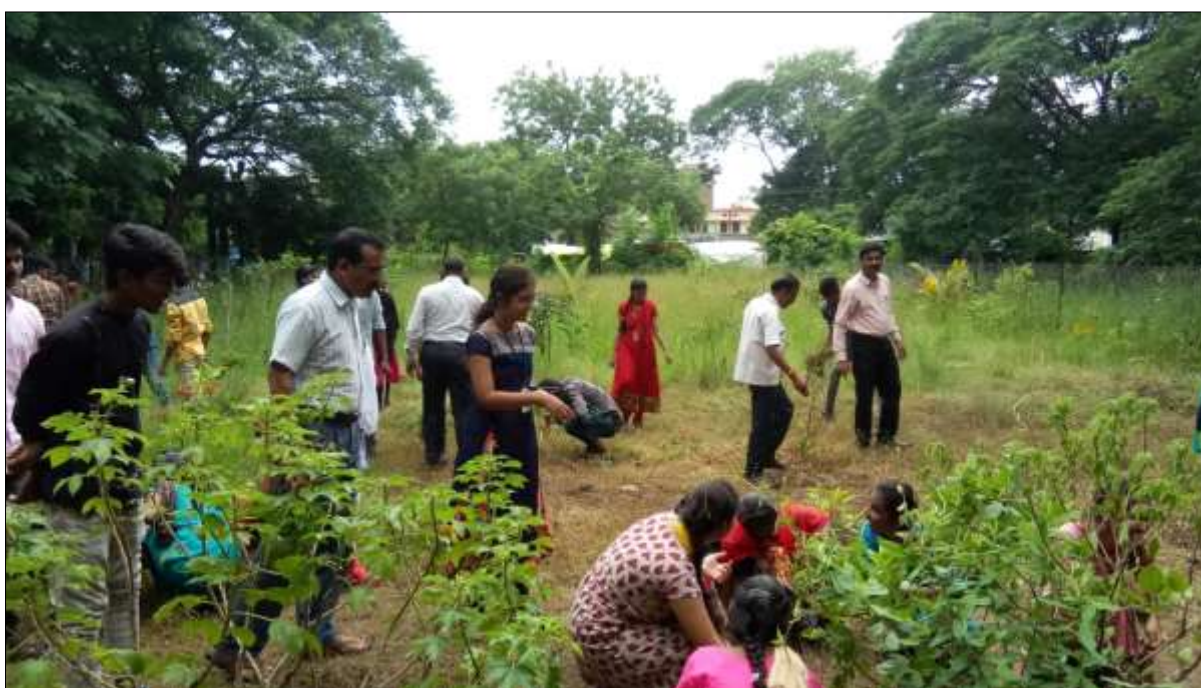
Volunteers participating in Swachh Bharath programme on 30-10-2019