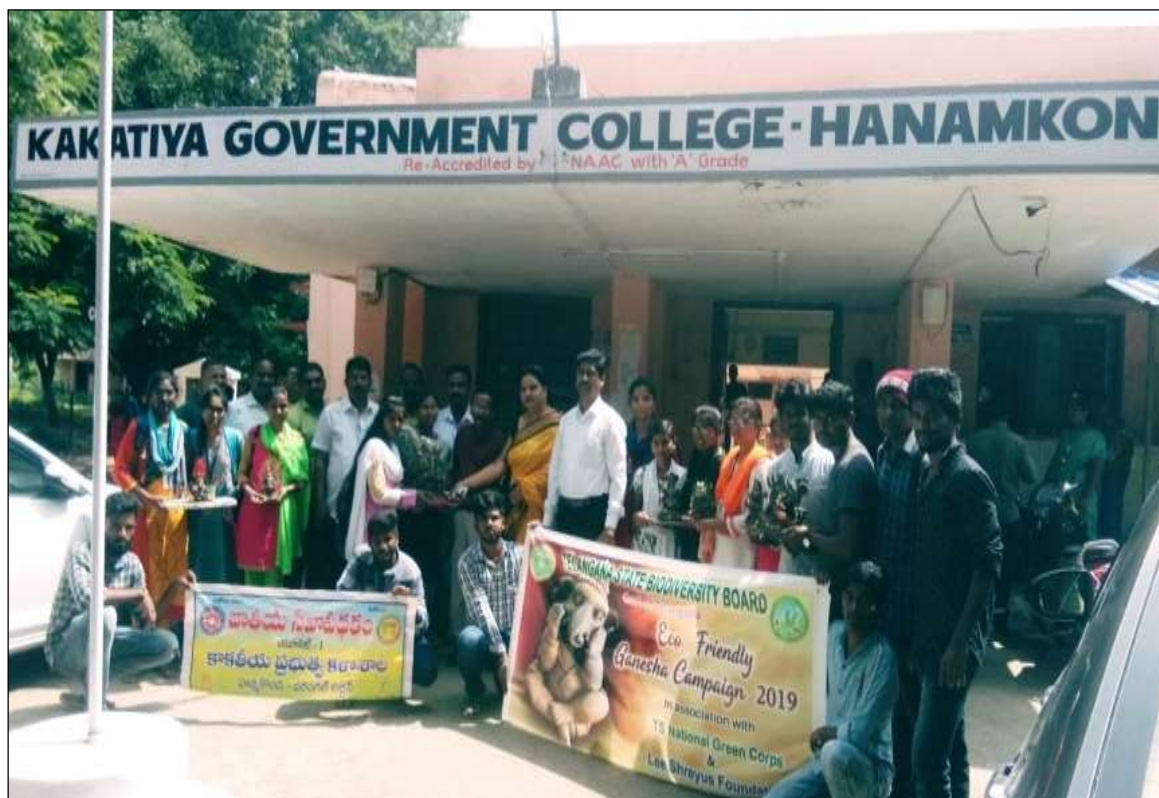
Distribution of Clay Vinayaka Idols to the people on 30-08-2019