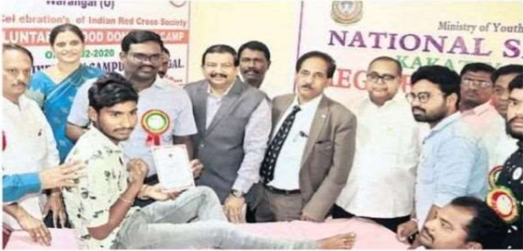
రక్తదానం చేసిన వలంటీర్లకు సర్టిఫికేట్లను ఇస్తున్న కలెక్టర్